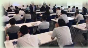
採用力向上セミナー