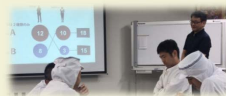
個別支援（コンサルティング）