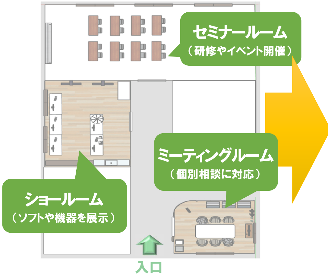
(センターの運営イメージ)