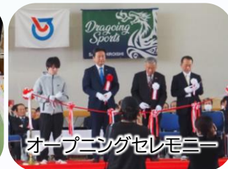
全10種目が揃う施設