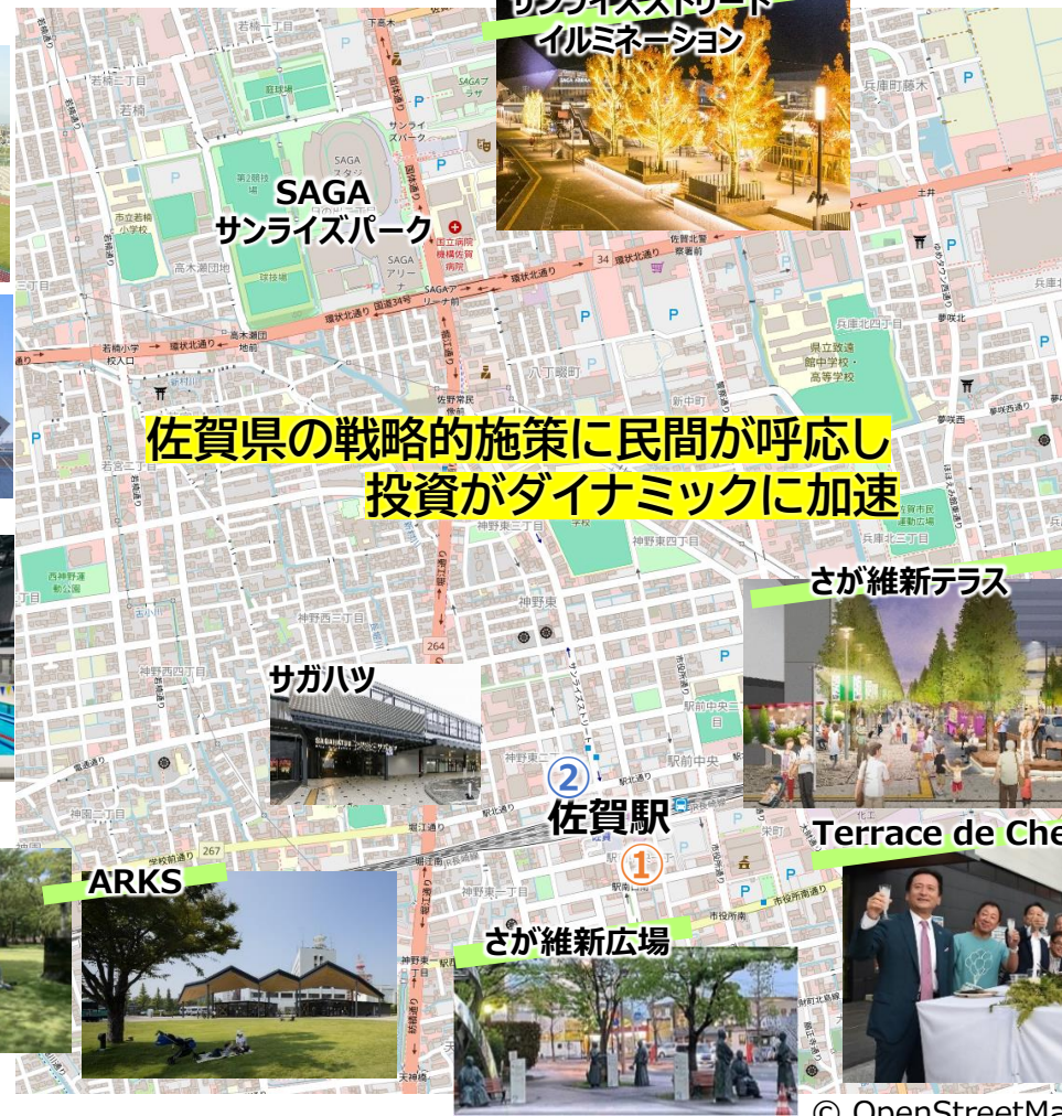
サンライズストリート イルミネーション