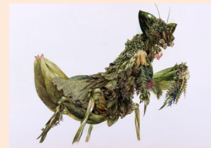
【くさかまきり】2004 チェゼン美術館蔵 撮影:宮島径 ©IKEDA Manabu Courtesy Mizuma Art Gallery