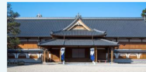
佐賀城本丸歴史館

※対象、ネット中継の有無、アーカイブ配信等は、講座に応じて各回それぞれで設定します。