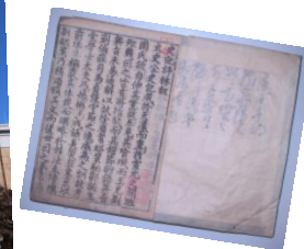
弘道館旧蔵書 （『史記評林』、 佐賀県立図書館蔵）