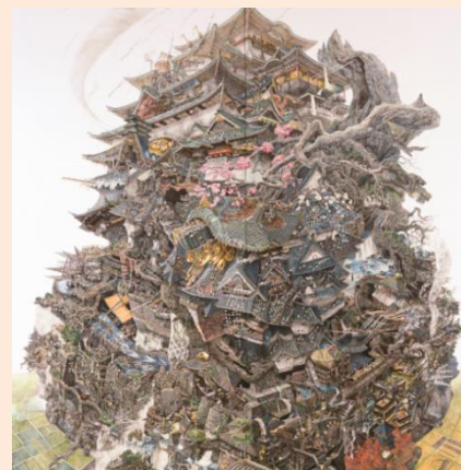
【興亡史】2006 高橋コレクション蔵 ©IKEDA Manabu