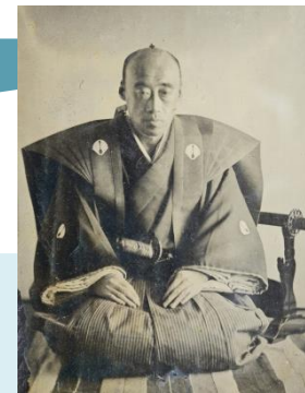
鍋島直正