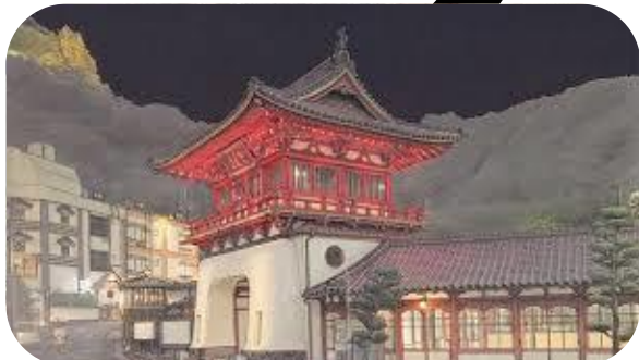
佐賀の風景に関する作品