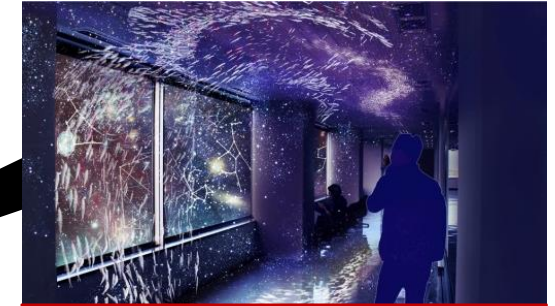
人の動きに連動する インタラクティブ作品