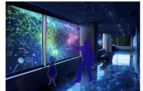
「アクアリウムトンネル」 「スターライトフィッシュ」

通行人に反応して魚たちが一気に現れ、 トンネルをつくったりします。窓に触れると、 触れた部分から魚たちが現れて集まってきます