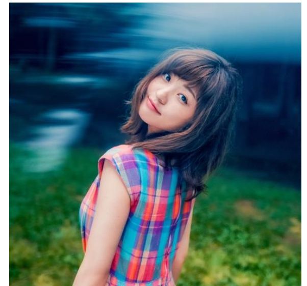
シンガーソングライター