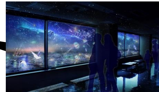
夜景プロジェクションマッピング