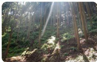
森林整備 (例：適切な森林管理を行うなど)