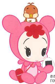
さがびよりキャラクター 「Dよりちゃん & ちゆんくん」