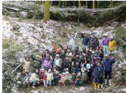
竹林を広葉樹の森林へ変えよう