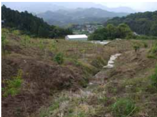
耕作放棄地を広葉樹の森林へ