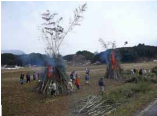
除去した竹を活用した鬼火焚きイベント