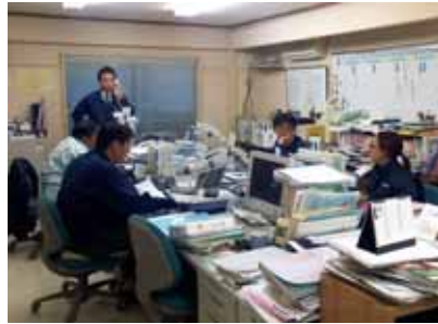
先進地現地研修(体制整備検討)