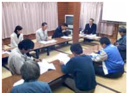
研修会の実施(棚田オーナー制度)