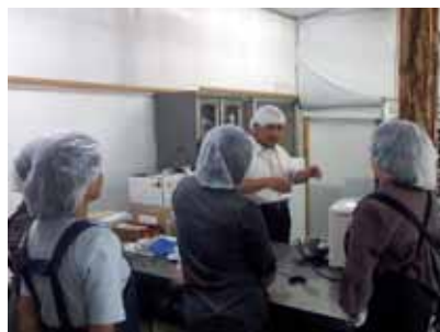
加工品開発・研修会(米粉パン)