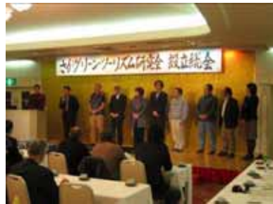
プロジェクト会議と連携し、農業者等による 「さがグリーン・ツーリズム研究会」の発足