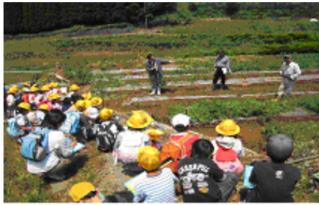
学校給食への地元産農産物の活用促進 生徒たちによる給食用ほ場の見学