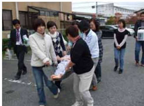
避難訓練実施状況