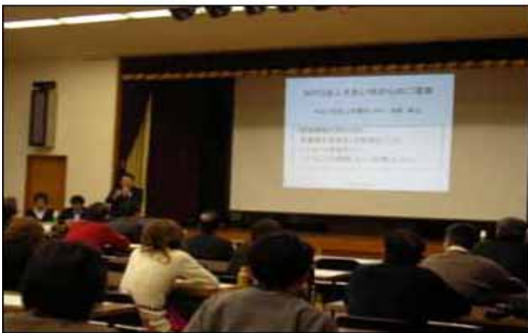
歯科医療従事者研修会