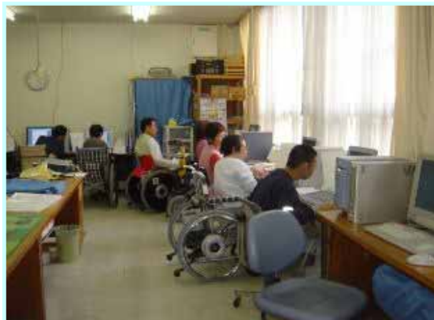
パソコンの訓練を行う障害者の方々

事業開始後10年目には、障害者の方々のパソコンによるネットワークを広げ、積極的な社会参加と就労促進を目指します。