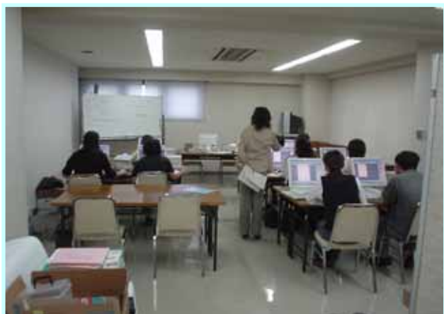
パソコンボランティア養成講座の受講風景

事業開始後10年目には、障害者の方々のパソコンによるネットワークを広げ、積極的な社会参加と就労促進を目指します。