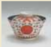
이로에(색화)적옥영자문개부대접 (色絵赤玉瑩紋蓋付碗) 1710~1750년대