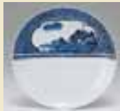
소메쓰케(청화)권선정화산수칠보채문접시 (染付片身窓絵山水七宝繋文皿) 1650~1670년대