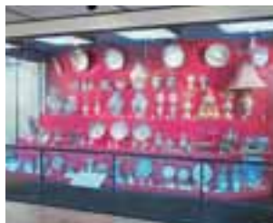
▲간바라(蒲原)컬렉션 - 아리타정(有田町)에 기탁

규슈도자의 학습실. 도자기의 역사와 특색을 알기 쉽게 소개하고 있습니다. 또한, 간바라컬렉션의 수출용 이마리(伊万里)도자기는 압권입니다.