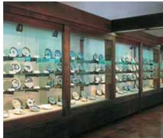
▲시바타부처 컬렉션(약 1300점 전시)

시바타부처로부터 기증된 에도(江戸)시대의 아리타자기를 전시. 아리타자기의 역사적 변천을 배울 수 있다.