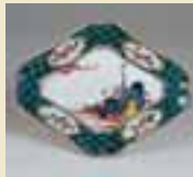
이로에(색화)주공문우임롱형접시 (色絵舟鈎文隅入菱形皿) 1650~1660년대