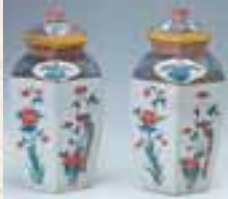
이로에(색화)화조문육각호 (色絵花鳥文六角壺) - 가키에문양식(柿右衛門様式)