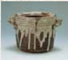
와라바이유류이부물병 (濁灰釉流耳付水指) - 치쿠젠·다카토리요(筑前・高取窯)