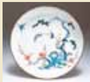
이로에(색화)쌍조송죽매문꽃장접시 (色絵双鳥松竹梅文輪花皿) 1670~1690년대