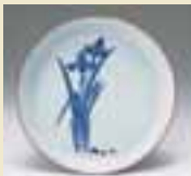
소메쓰케(청화)창포문접시 (染付菖蒲文皿) 1670~1690년대