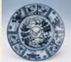
소메쓰케(청화)부용수봉황문접시 (染付芙蓉手鳳凰文大皿)VOC명