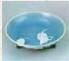
Dreifüßiger Teller mit Reihermotiv in Unterglasur. Wichtiges Kulturdenkmal. (Fürstliche Nabeshima-Porzellanmanufaktur)