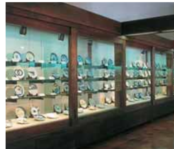
▲ Shibata-Sammlung (ca. 1.200 Exponate)

In diesem gesonderten Raum wird ein Teil der Sammlung von Arita-Porzellan aus der Edo-Zeit (1600 - 1868) des Ehepaars Shibata ausgestellt. Anhand dieser Sammlung werden die Veränderungen des Arita-Porzellans im Lauf der Geschichte deutlich gemacht.