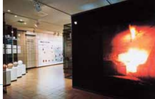
▲ Ausstellungsraum 4