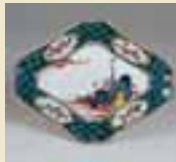
Länglicher Teller mit Anglermotiv in Aufglasur. (ca. 1650 - 1670)