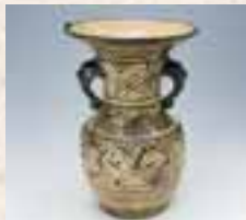
Henkelvase in Unterglasur. Vietnamesischer Stil. (Stilart: Naeshiro-gawa; Region: Satsuma)