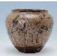
▲ Vase mit Herbstblumenmotiv in Eisenoxyd („ E-garatsu “)

Angefangen mit Alt-Karatsu („ Ko-garatsu “) und frühen Imari Keramiken werden hier, neben berühmten Porzellanen im Kakiemon-Stil und aus den privaten Öfen der Fürstenfamilie Nabeshima, auch alte Keramiken aus diversen anderen Manufakturen Kyushus gezeigt.