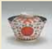
Deckelschale mit Juwelenmuster in Aufglasur. (ca. 1710 - 1760)