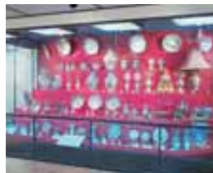
▲ Kanbara-Sammlung (Leihgabe an die Stadt Arita)

Studienraum für Kyushu-Keramik. Dem Besucher werden hier auf eine einfache und verständliche Weise die Geschichte und die Charakteristiken des Porzellans aus Kyushu näher gebracht. Darüber hinaus ist eine hervorragende Auswahl an Exportporzellan aus der Kanbara-Sammlung zu sehen.