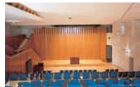
▼ Auditorium mit 200 Sitzplätzen (Erdgeschoss)