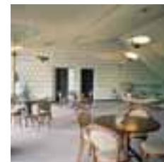
▲ Cafe Terrasse (2. Stock)