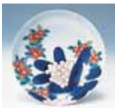
▲ Teller mit Rhododendron- und Azaleen-Muster (Fürstliche Nabeshima-Porzellanmanufaktur)