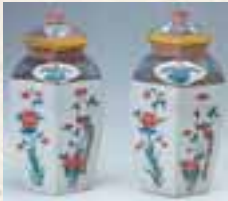
Sechseckige Gefäße mit Vogelmotiv in Aufglasur. (Kakiemon-Stil)