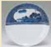
Teller mit chinesischem Landschaftsmotiv in Unterglasur. (ca. 1650 - 1680)