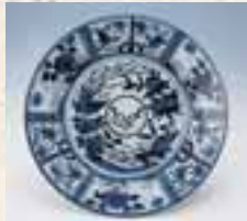
Großer Teller mit Initialien der Niederländischen Ostindien Kompanie (VOC) in Unterglasur.