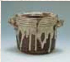
Wassergefäß mit Ohrenhenkeln. Ascheglasur. (Stilart: Takatori; Region: Chikuzen)