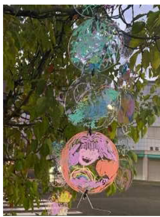
製作した数多くのオーナメント