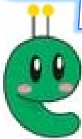
佐賀県の環境キャラクター 「ピコピコ」