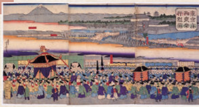
明治天皇が京都から東京へと行幸する様子を描いた浮世絵。歌川芳虎《東京府御東幸行烈図》(東京都江戸東京博物館蔵)

都を移す「遷都」の議論は大久保利通の「大坂遷都」の建白によって盛んになります。京都の公家らの猛反対を受け、戊辰戦争に活躍した江藤は、江戸開城直後、先に「東西両京」を置く案を持って、大木と連名で建白書を提出。他に先駆けて、「江戸