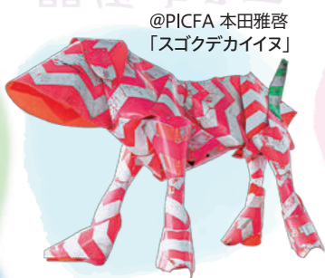
@PICFA 本田雅啓 「スゴクデカイイヌ」

期間 8月22日(金)～10月12日(金) ※休館日:月曜日(祝日・休日のときは翌日) ところ 県立博物館 3号展示室(佐賀市内)