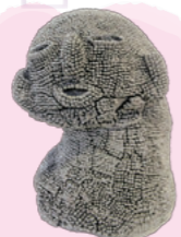
@PICFA 中川あすか 「基峰鶴(日本酒)の中に紛れしモノ ～3つの油が入った壺を探し出せ～」