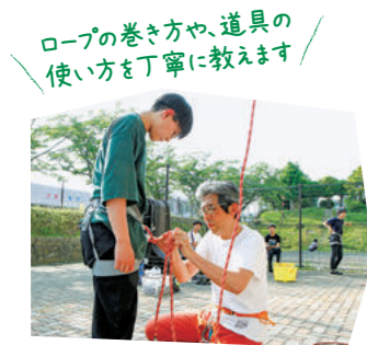
ロープの巻き方や、道具の使い方を丁寧に教えます