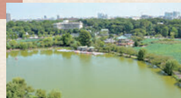
アームストロング砲の砲弾は不忍池を越え、上野寛永寺の彰義隊を攻撃した

解しました。上野戦争後は、長州藩の大村益次郎が誇るアームストロング砲による攻撃で彰義隊は瓦解しました。上野戦争後は