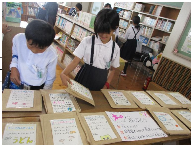
休み時間に「本の福ぶくろ」の中から本を選んでいる様子