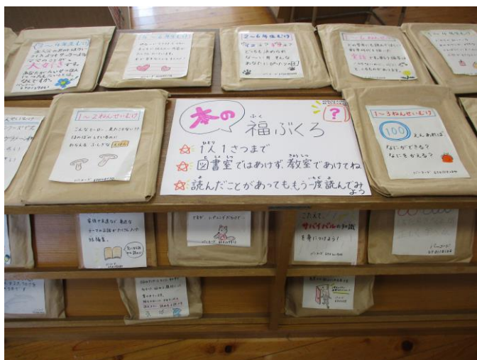
「本の福ぶくろ」の展示の様子