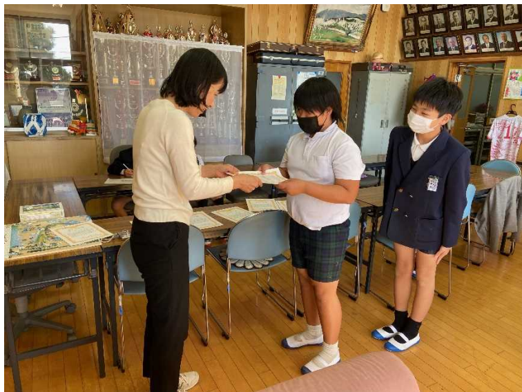
毎月初めに校長室で表彰