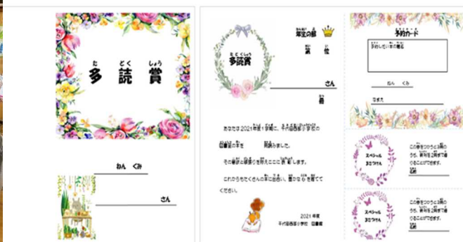
毎学期、年度末に表彰