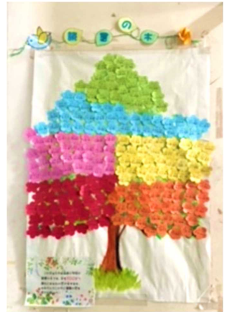
100冊以上借りた児童の名前