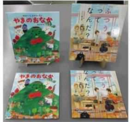
←上が絵本、下がパズル