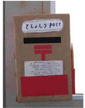
↑ 図書館入口設置のポスト