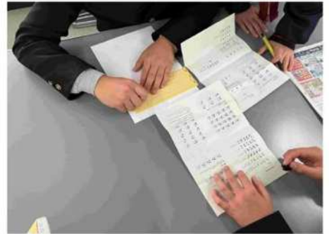
↑一覧を見ながら点字を打っている様子