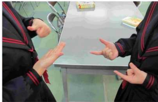
↑手話でのコミュニケーションの様子