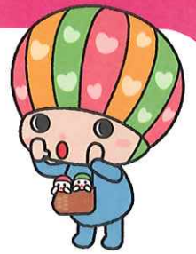
佐賀県子育て応援キャラクター さがっぴい