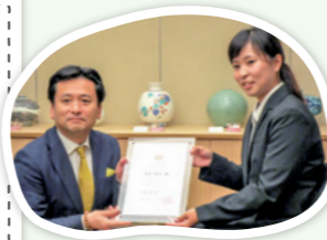
H29年度さがんアスリートに認定されました！