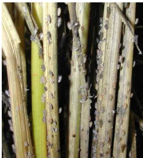
株元に寄生、吸汁するトビイロウンカ