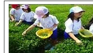
3年生 お茶摘み体験

西川登町は、武雄市の西部に位置し、お茶作りの盛んな地域である。西川登小学校では、お茶摘み体験や茶道体験などを通して地域の産業にふれ地域の方とふれあう学習を行っている。