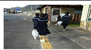
クリーン作戦に取り組む生徒たち

本年度は、部活動を通じて体力や技能の向上、協調性や連帯感を育むだけでなく、日頃お世話になっている地域への感謝(恩返し)の思いも込めて、各部活動の主将がリーダーとなり、月1回の「クリーン作戦」に取り組んでいる。