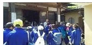
地域の方の話を聞く生徒たち

北方中学校の2年生は、総合的な学習の時間に町内の歴史や自然について学ぶ「北方歴史探訪」を実施している。二つのコースに分かれて地域の方の講話を聞き、事前にコース上の各所について調べ学習を行う。