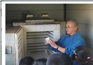
江口氏による焼き物講話

東川登町は、武雄市の南部に位置し、米・野菜作りの盛んな地域である。東川登小学校では、相撲大会や運動会などを通して地域の方との交流を行っている。