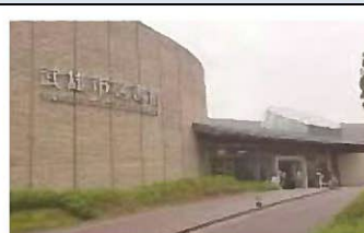
武雄市図書館・歴史資料館