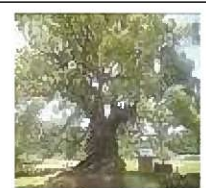
大楠公園として整備されている。

若木町にある川古の大楠は、全国第5位の巨木。樹齢3千年で国の天然記念物にも指定されている。