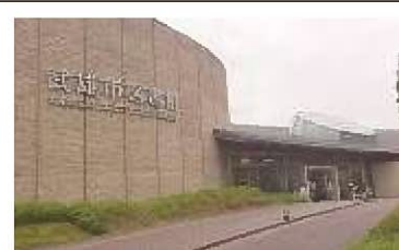
武雄市図書館・歴史資料館

教育委員会所在地：武雄市武雄町大字昭和1-1 連絡先：(学校教育課) 0954-23-8010 学校数：小学校 11校、中学校 5校