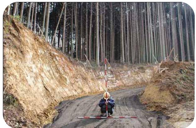
林業専用道 (鳥海～踊瀬線)(施行中)