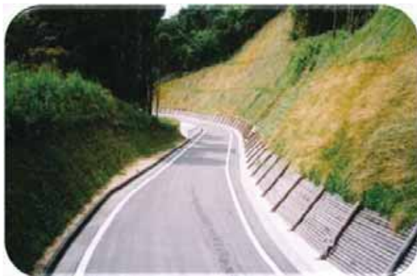
森林管理道 (陣の山線)