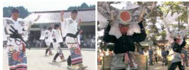
△ 武雄の荒踊(武雄市)

唐津くんちの曳山行事や武雄の荒踊など、佐賀県には特色ある伝承芸能が数多く受け継がれています。こうした地域の宝を継承することは、郷土愛を育むとともに、誇りと志を醸成し、地域の活性化につながります。このため、県では、広く県民の皆様に伝承