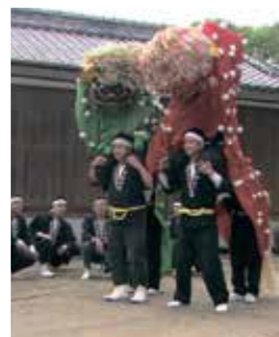
△ 三重の獅子舞(佐賀市)