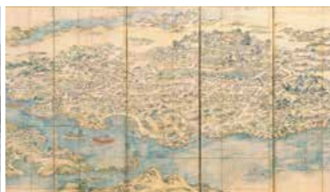
△ 肥前名護屋城図屏風 佐賀県重要文化財 佐賀県立名護屋城博物館蔵