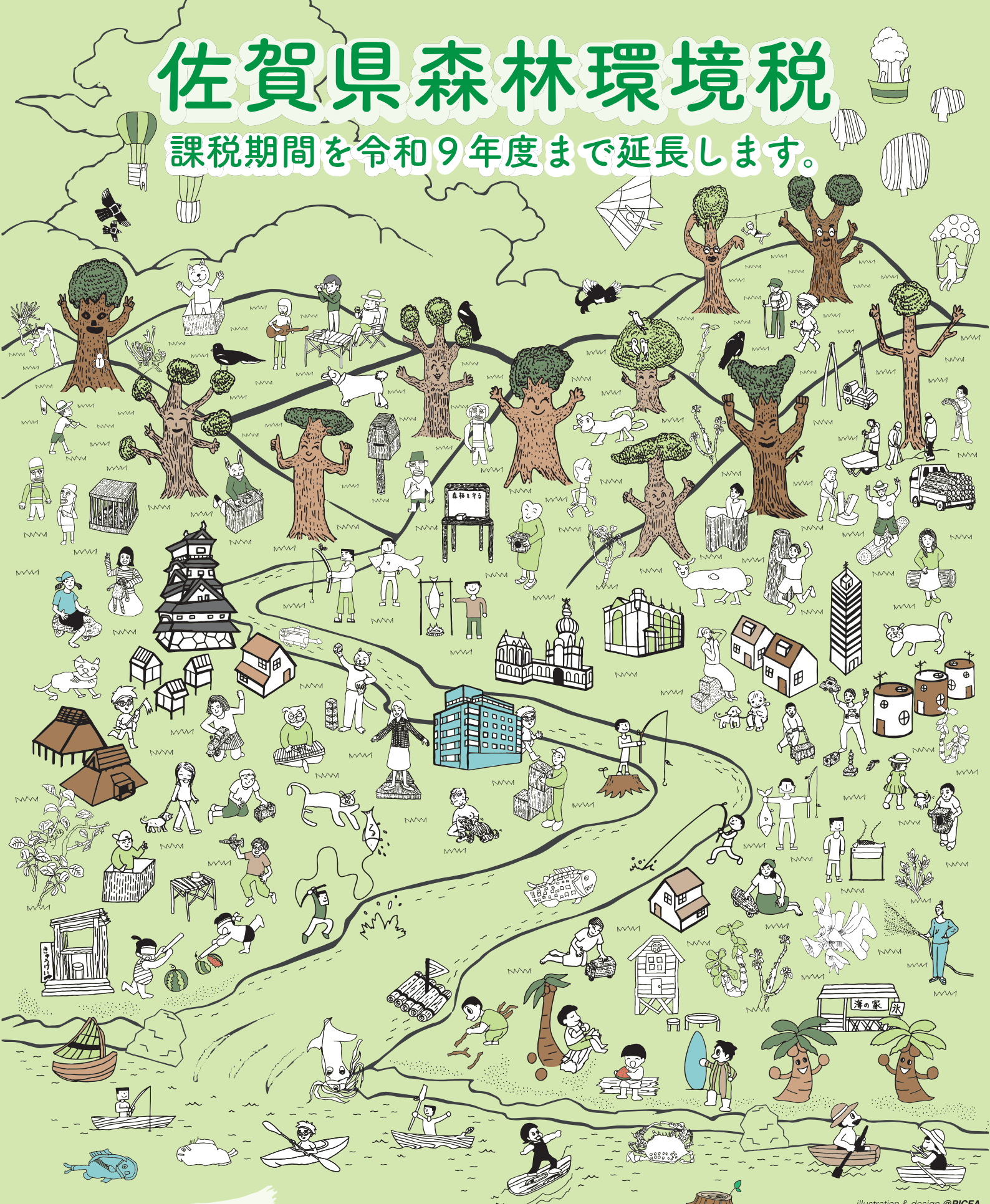
illustration & design @PICFA