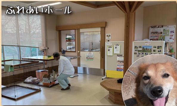
広くて明るいホールでは、しつけ方の相談会なども行っています。