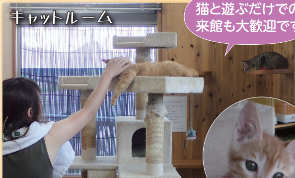
猫と遊ぶだけの来館も大歓迎です