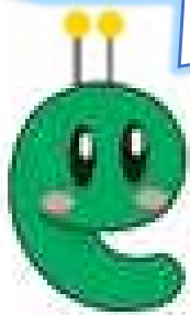
佐賀県の環境キャラクター 「ピコピコ」