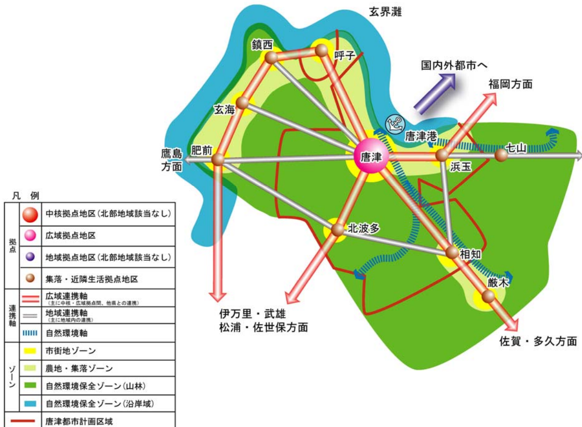
図-3 将来地域構造 (北部地域都市計画マスタープランから抜粋)