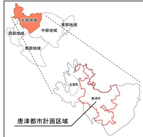
図-2 唐津都市計画区域の位置

このため、北部地域の中心都市としての拠点性を高め、都市機能と産業機能の集積・向上を図っていく必要がある。また、区域内の優れた自然環境や唐津城や唐津くんちをはじめとした歴史・文化資源について、本区域固有の財産として保全を図るとともに、地域振興等の地域の活性化に向けた活用を図っていく必要がある。