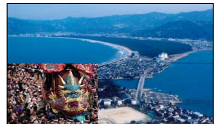
虹の松原及び唐津くんちの様子

虹の松原や鏡山など風光明媚な玄界灘の自然や作礼山や八幡岳などの豊かな緑の自然、唐津城や唐津くんちなど市街地の中心部に数多く存在する歴史・文化的資源の保全を図るとともに、魅力ある都市空間整備や、商業、観光、産業の振興及びレクリエーションの場としての活用に結びつけ、自然と歴史と文化を育み活かすまちを目指す。