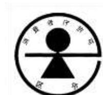
(b) 特別用途食品の標識

以上に述べた(a) 保健機能食品、(a) ① 特定保健用食品、(a) ② 栄養機能食品、(a) ③ 機能性表示食品、(b) 特別用途食品（特定保健用食品を除く。）の規制上の関係を図示すると次表のとおりとなる。