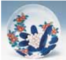
▲色絵石楠花躑躅文皿 (鍋島藩窯)