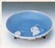
染付簾文三脚付皿(鍋島藩窯) 重要文化財