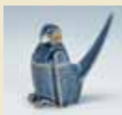
瑠璃釉 鳥形合子 (1630～1640年代)