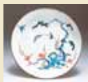
色絵松竹梅岩鳥文輪花皿 (1670～1690年代)