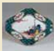
色絵舟人物文菱形小皿 (1650～1660年代)