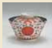
色絵 赤玉瓔珞文 蓋付碗 (1720～1760年代)