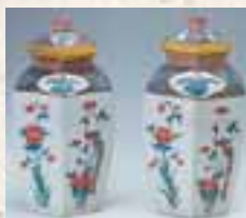
色絵花鳥文六角壺(柿右衛門様式)