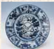
染付芙蓉手鳳凰文大皿：VOC銘