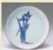
染付 菖蒲文皿 (1670～1690年代)