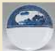
染付 山水七宝文皿 (1655～1670年代)