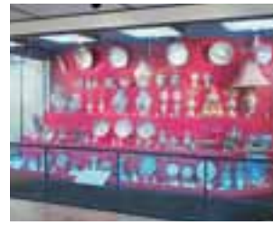
▲蒲原コレクション(有田町寄託)

九州陶磁の学習室。やきものの歴史と特色をわかりやすく紹介しています。また蒲原コレクションの輸出伊万里は圧巻。