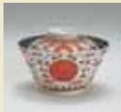
彩绘 赤玉瑠璃文付盖碗 (1710 - 1750年)