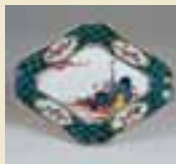
彩绘舟钓文隅人菱形皿 (1650 - 1660年)