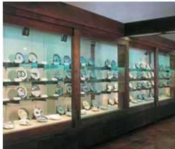
▲柴田夫妻收藏品(大约展示1200点)