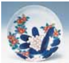
▲色絵石楠花躑躅文皿(鍋島藩窯)