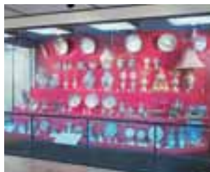
▲蒲原收藏品(有田町委托)

九州陶瓷学习室，介绍陶瓷的历史与特色。此外蒲原收藏品集伊万里输出陶瓷器之大成是本馆的精华所在。