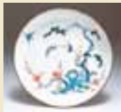
彩绘双鸟梅文轮花皿 (1670 - 1690年)