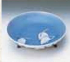
青花堂文三脚皿 (锅岛藩窑) 重要文化财