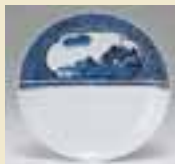
青花片身山水画面七宝系文皿 (1650 - 1670年)