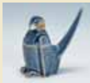
琉璃釉鳥形香盒 (1630~1640年代)