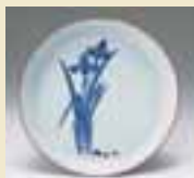
青花 菖蒲文皿 (1670~1690年代)