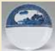
青花片身山水畫七寶繫文皿 (1650~1670年代)