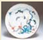
彩繪雙鳥梅文輪花皿 (1670~1690年代)