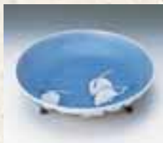
青花鸞文三腳皿 (鍋島藩窯) 重要文化財