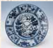
青花芙蓉手鳳凰文大皿:VOC製