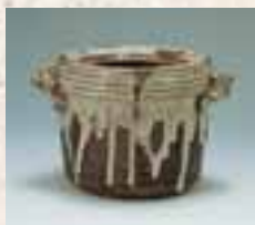
稻草灰流釉付耳水壺 (筑前・高取窯)