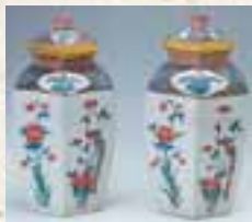
彩繪花鳥文六角壺 (柿右衛門式樣)